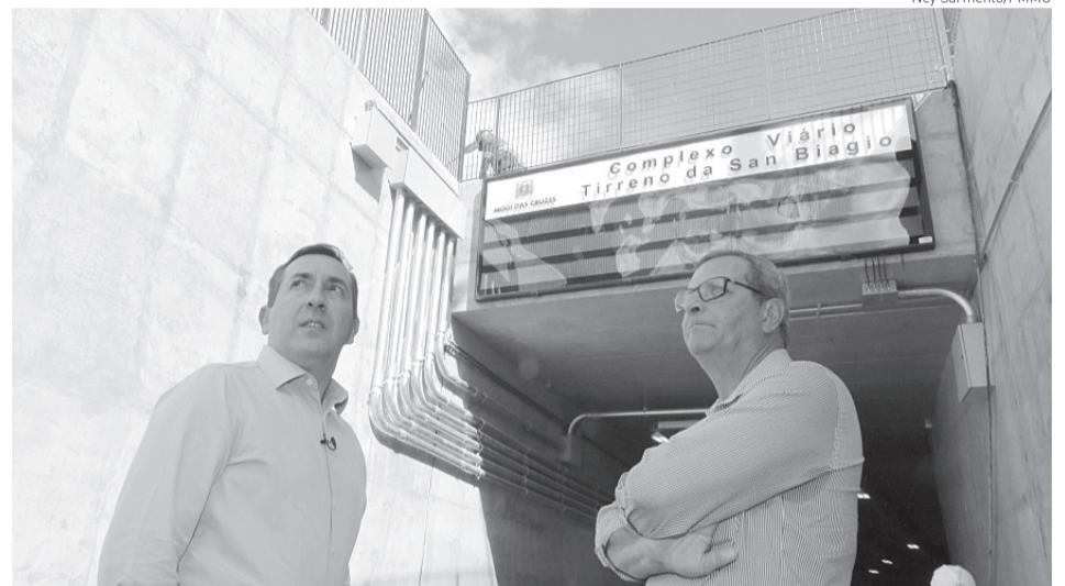
Prefeito vistoriou o espaço na tarde de ontem e comentou sobre o possível acesso

Com a conclusão das duas passagens, a Prefeitura dará início a uma nova etapa do trabalho de mobilidade na região central. A área das praças Oswaldo Cruz e Sacadura Cabral, além do espaço do antigo posto, passará por uma requalificação e terá novo projeto arquitetônico, paisagismo e acessibilidade, sempre a partir de um diálogo